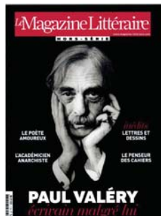
LE MAGAZIN LITTERAIRE HS COLLECTION Pvp/Psp - € 6,00 Irregular Literatura / Literature