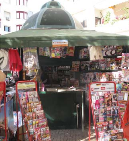
Quiosque da Praça da República, Costa da Caparica Praça da Liberdade 2825-386 Costa da Caparica