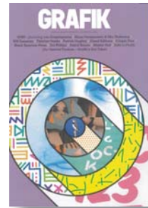
GRAFIK Pvp/Psp - € 16,00 Irregular Design