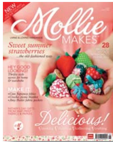
MOLLIE MAKES Pvp/Psp - € 7,70 9 x ano / year Lavares / Handcraft