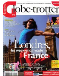
GLOBE-TROTTER Pvp/Psp - € 6,90 Bimestral / Bimonthly Viagens / Travelling