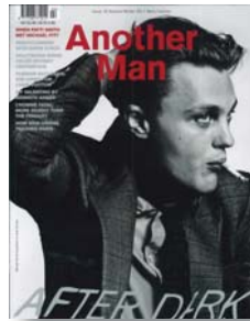
ANOTHER MAN Pvp/Psp - € 9,95 Semestral / Semi-annual Moda Masculina / Man Fashion