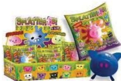
SPLATTEROSI Pvp/Psp - € 1,99 One shot Infantil-Bonecos / Kids-Toys